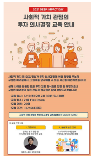
사회적 가치 관점의 투자 교육