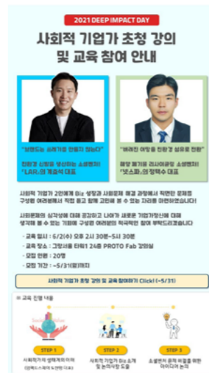
사회적 기업가 초청 강의 및 교육