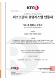
리스크관리 경영시스템 인증서