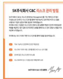
리스크 관리 방침