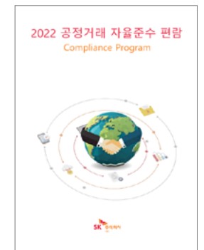
공정거래 자율준수 편람