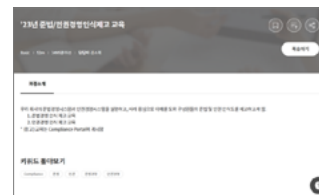
준법경영 인식제고 교육