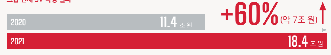
그룹 전체 SV 측정 결과

SK는 제품과 서비스가 만들어지고 제공되는 모든 과정에 사회적 가치를 담습니다. 그리고 그 가치가 우리 사회에 미친 긍정적인 영향력을 객관적으로 측정하여 투명하게 공개함으로써 사회 구성원 모두의 공존과 행복을 추구하는 방향으로 비즈니스 혁신을 이루어 가고 있습니다.